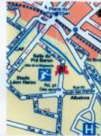
Ponto5- dans le parking à côté du contrôle technique

Il n'y a pas d'âge pour se révolter et le dire